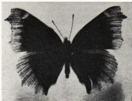
Fig. 2. Nymphalis antiopa ab. hygiaea Heydr.

naturliga förhållanden kläckt exemplar med smala vingar och med urgröpnig i bakkanten av framvingarna.